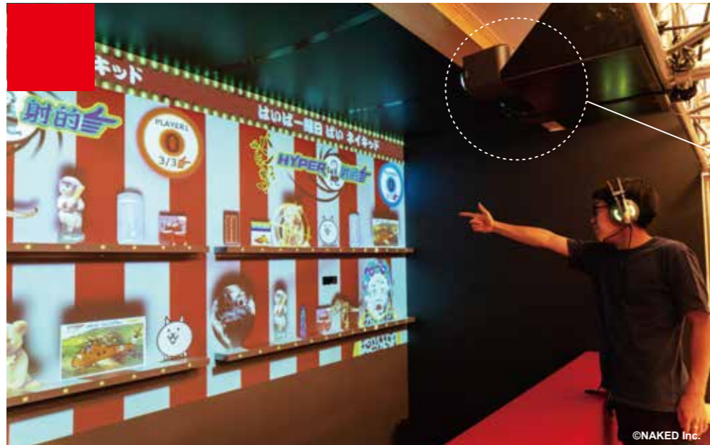
"NAKED의 Hyper Fair 박람회"