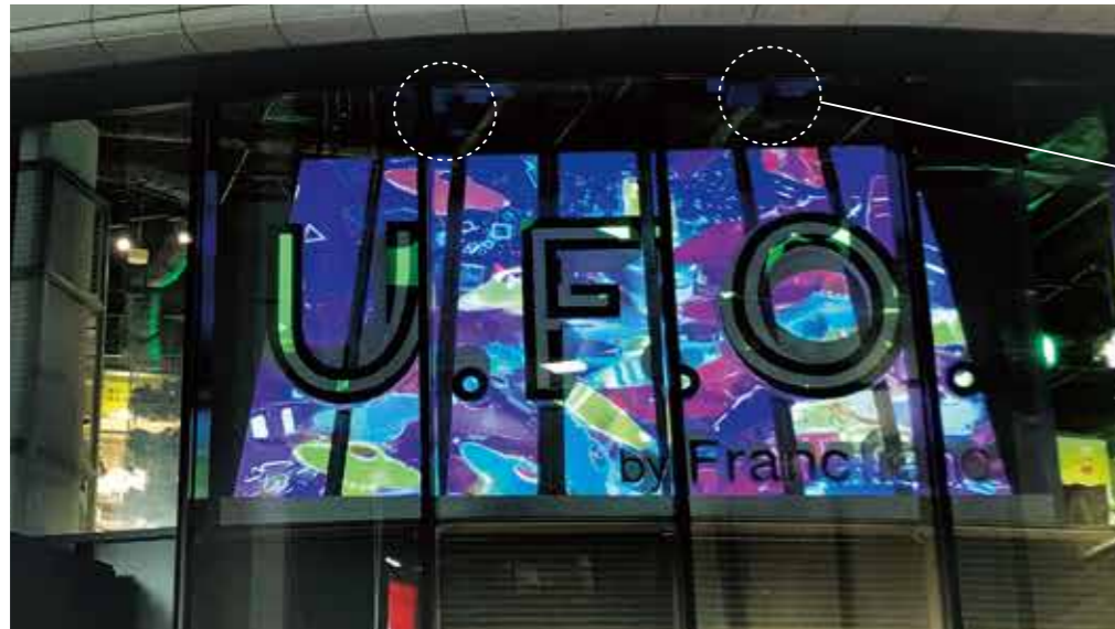
Francfranc LINKS UMEDA의 U.F.O.